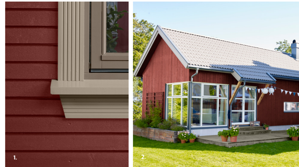
1. VEGG: DRYGOLIN NORDIC EXTREME 2006 HUSMANNSRØD VINDU: DRYGOLIN NORDIC EXTREME VINDU & DØR 10254 BRUN JORD OG 1284 SVOLVÆR 2. VEGG: DRYGOLIN NORDIC EXTREME 2746 MØRK RUBIN DETAJER/VINDU: DRYGOLIN NORDIC EXTREME VINDU & DØR 1378 KONTUR OG 1376 FROSTRØYK TERRASSE: TREBITT 9710 TERRASSEGRÅ 3. VEGG: DRYGOLIN COLOR EXPERT 2279 DODENKOPF GRUNNMUR: JOTUN DRYTECH MURMALING 1352 FORM

Rødt har lange og stolte tradisjoner, og har preget og beriket kyst og land gjennom historien. Du kan være trygg på at Jotuns utvalgte rødfarger er solide og trygge rødtone utendørs.