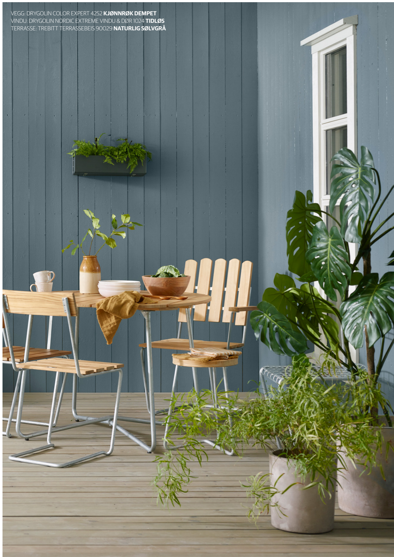
VEGG: DRYGOLIN COLOR EXPERT 4252 KJØNNRØK DEMPET VINDU: DRYGOLIN NORDIC EXTREME VINDU & DØR 1024 TIDLØS TERRASSE: TREBITT TERRASSEBEIS 90029 NATURLIG SØLVGRÅ

Blåtoner forsterkes ofte i møte med himmel, natur og omgivelser. Utendørs er derfor de dempede og grålige blåtonene de vakreste.