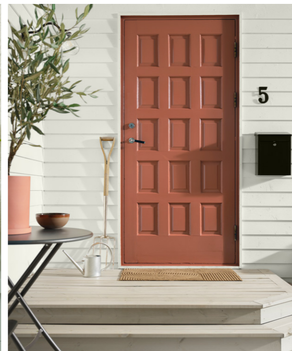
VEGG: DRYGOLIN NORDIC EXTREME 10784 SKYGGEHVIT DØR: DRYGOLIN NORDIC EXTREME VINDU & DØR 20118 AMBER RED TERRASSE: TREBITT TERRASSEBEIS 9073 SHIMMERGRÅ