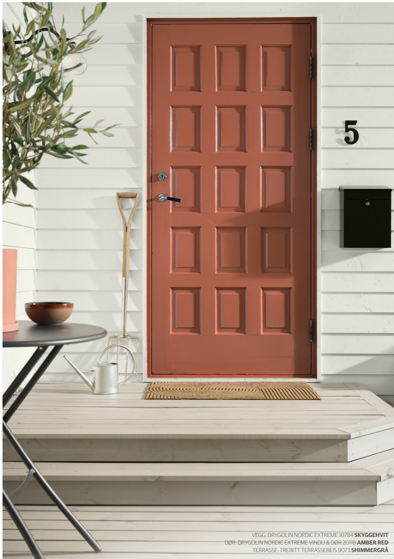
VEGG: DRYGOLIN NORDIC EXTREME 10784 SKYGGEHVT DØR: DRYGOLIN NORDIC EXTREME VINDU & DØR 20118 AMBER RED TERRASSE: TREBITT TERRASSEBEIS 9073 SHIMMERGRÅ