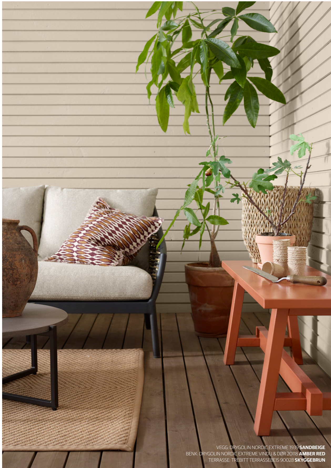
VEGG: DRYGOLIN NORDIC EXTREME 1939 SANDBEIGE BENK: DRYGOLIN NORDIC EXTREME VINDU & DØR 20118 AMBER RED TERRASSE: TREBITT TERRASSEBEIS 90028 SKYGGEBRUN