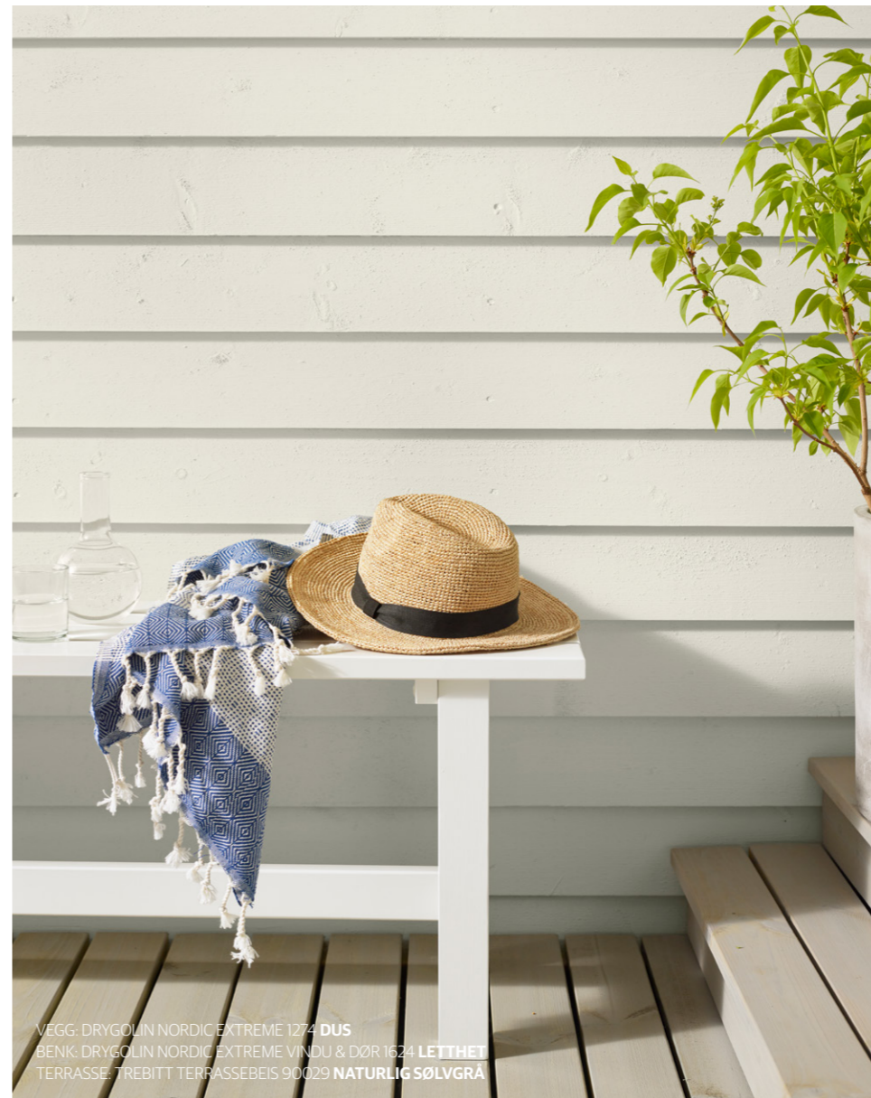
VEGG: DRYGOLIN NORDIC EXTREME 1274 DUS BENK: DRYGOLIN NORDIC EXTREME VINDU & DØR 1624 LETTET TERRASSE: TREBITT TERRASSEBEIS 90029 NATURLIG SØLVGRÅ