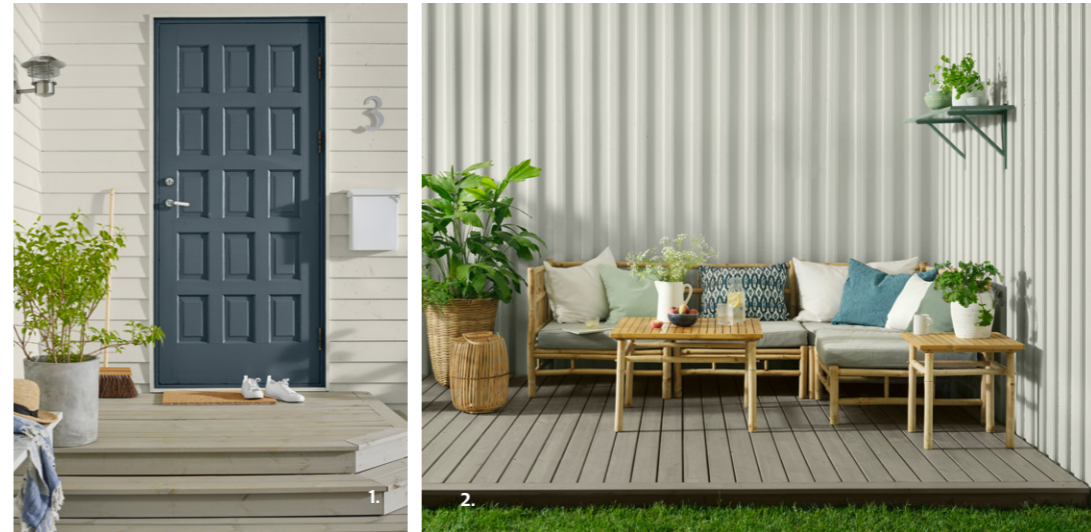
1. VEGG: DRYGOLIN NORDIC EXTREME 1274 DUS DØR: DRYGOLIN NORDIC EXTREME VINDU & DØR 5445 DELICATE BLUE TERRASSE: TREBITT 90029 NATURLIG SØLVGRÅ

Små ulikheter i nyanse utgjør stor forskjell på en hel fasade. I år supplerer vi våre lyse bestselgere med en ny grålig hvittone, Jotun 1274 Dus , samt en tidløs og vakker gråtone ved navn Jotun 1069 Villagrå .