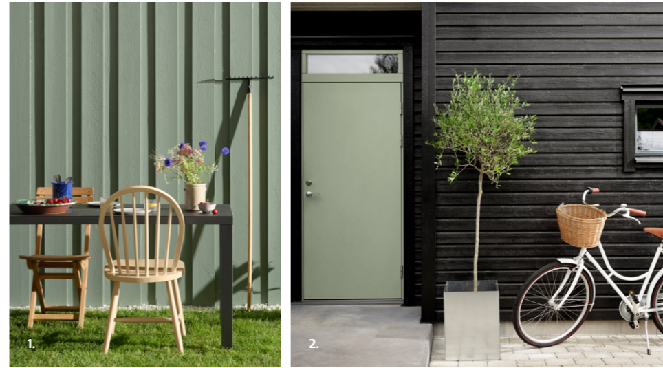
1. VEGG: DRYGOLIN COLOR EXPERT 7653 STOCKHOLMSGRØNN STOL: DRYGOLIN NORDIC EXTREME VINDU & DØR 1908 SISAL

Fargesett gjerne staffasje og detaljer i lysere eller mørkere nyanser av fasadefargen for et dempet og helhetlig uttrykk. Grålige og gylne hvittoner er også vakre i møte med en grønn fasade.