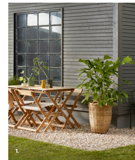
VEGG: DRYGOLIN COLOR EXPERT 9938 DEMPET SORT KRAKK: DRYGOLIN NORDIC EXTREME VINDU & DØR 9938 DEMPET SORT

Varme gråtoner sørger for god harmoni med natur og omgivelser. Blant de sorte fargene vil undertonen avgjøre om fargen fremstår som lun og brunlig, eller om den dreier mot det grålige og kullsorte.