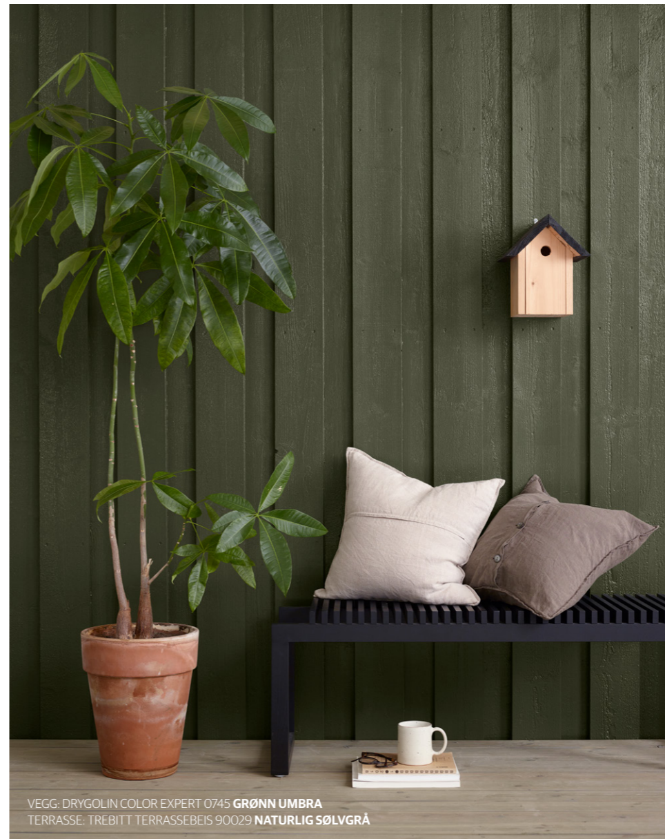
VEGG: DRYGOLIN COLOR EXPERT 0745 GRØNN UMBRA TERRASSE: TREBITT TERRASSEBEIS 90029 NATURLIG SØLVGRÅ