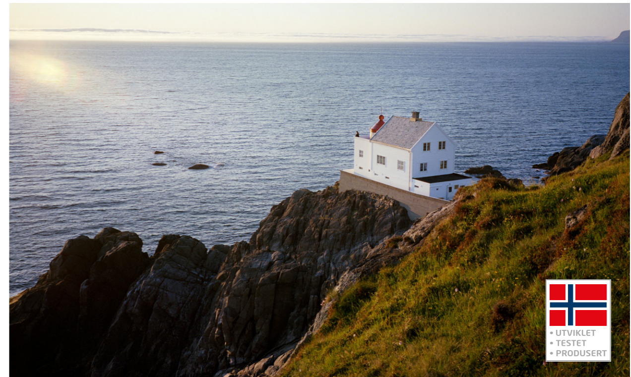
STORE VARIASJONER I DET NORSKE VÆRET SETTER STADIG HØYERE KRAV TIL BÅDE FARGER OG PRODUKT. KRÅKENES FYR ER ETT AV FLERE TESTSTEDER UTENDØRS.

Fremtidens vær krever trygg maling. Å velge høykvalitetsprodukter som er utviklet for å sikre langvarig beskyttelse er et mer bærekraftig valg. Finn fargene som passer best til ditt hus, og velg en maling fra Jotun som beskytter godt og lenge. Velger du høykvalitet er det lenge til neste gang du må male, og det er godt å vite at du har gitt huset den aller beste beskyttelsen.