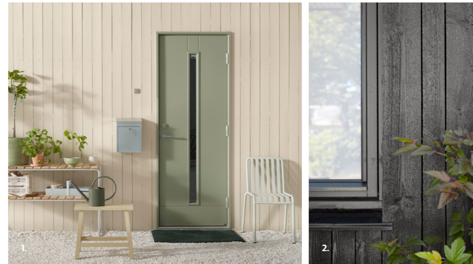
1. VEGG: DRYGOLIN NORDIC EXTREME 1141 NATURAL BEIGE DØR: DRYGOLIN NORDIC EXTREME VINDU & DØR 8426 DEWY GREEN KRAKK: DRYGOLIN NORDIC EXTREME VINDU & DØR 1908 SISAL

Jotun 0734 Brunsvart er en av landets mest populære farger, en perfekt farge for den som ønsker et mørkt, men ikke helt kullsort hus.