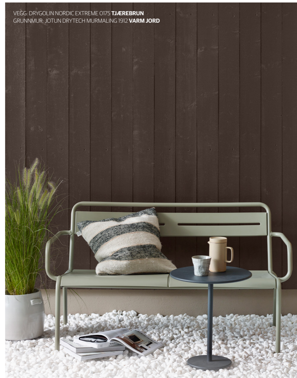
VEGG: DRYGOLIN NORDIC EXTREME 0175 TJÆREBRUN GRUNNMUR: JOTUN DRYTECH MURMALING 1912 VARM JORD