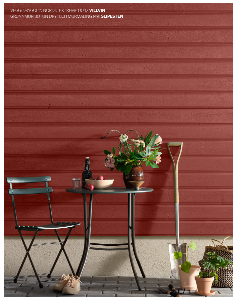
VEGG: DRYGOLIN NORDIC EXTREME 0042 VILLVIN GRUNNMUR: JOTUN DRYTECH MURMALING 1491 SLIPESTEN