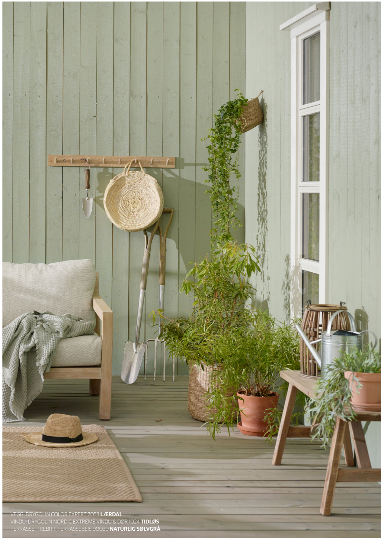
VEGG: DRYGOLIN COLOR EXPERT 7053 LÆRDAL VINDU: DRYGOLIN NORDIC EXTREME VINDU & DØR 1024 TIDLØS TERRASSE: TREBITT TERRASSEBEIS 90029 NATURLIG SØLVGRÅ