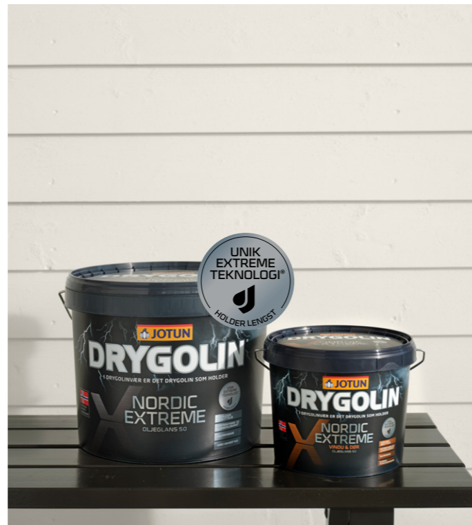
VEGG: DRYGOLIN NORDIC EXTREME 10784 SKYGGEHVIT BENK: DRYGOLIN NORDIC EXTREME VINDU & DØR 0099 SORT

I dette fargekartet har vi samlet trygge, gode husfarger fra våre fargeeksperter. Alle fargene presenteres med anbefalte kombinasjonsfarger for hele huset, til grunnmur, terrasse, vindu, dør og detaljer. En vakker, helhetlig fargepalett sammen med høykvalitetsprodukter gir et varig vakkert hus .