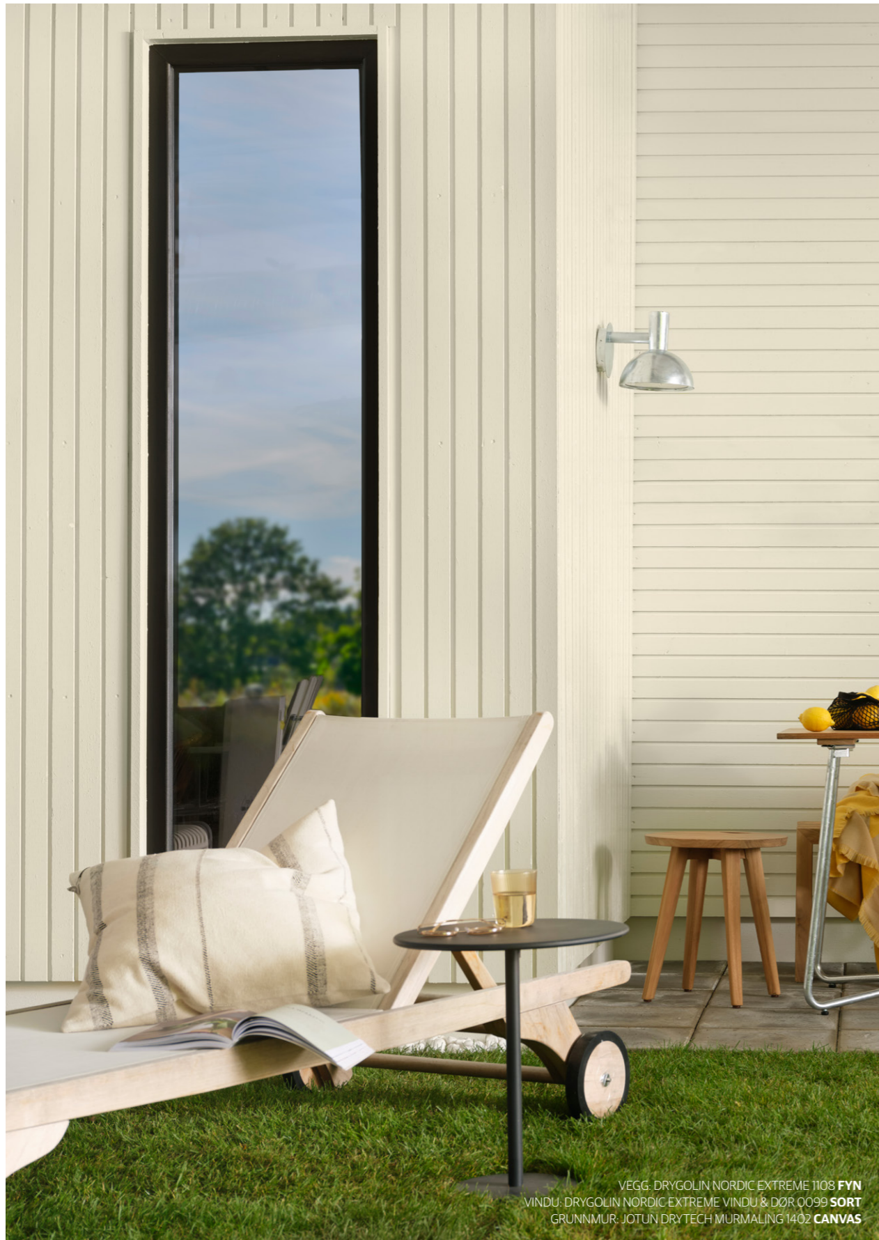
VEGG: DRYGOLIN NORDIC EXTREME 1108 FYN VINDU: DRYGOLIN NORDIC EXTREME VINDU & DØR 0099 SORT GRUNNMUR: JOTUN DRYTECH MURMALING 1402 CANVAS