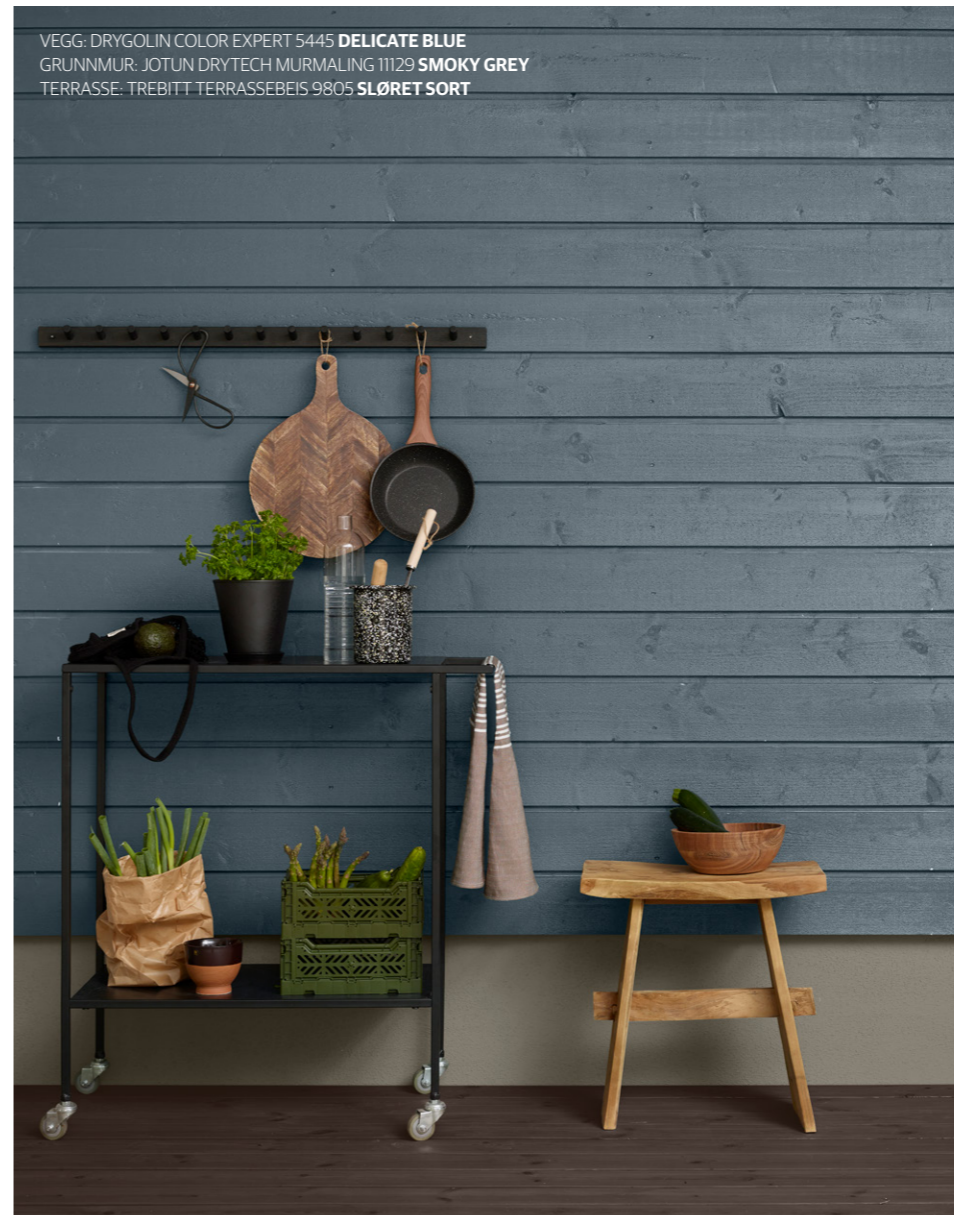
VEGG: DRYGOLIN COLOR EXPERT 5445 DELICATE BLUE GRUNNMUR: JOTUN DRYTECH MURMALING 11129 SMOKY GREY TERRASSE: TREBITT TERRASSEBEIS 9805 SLØRET SORT