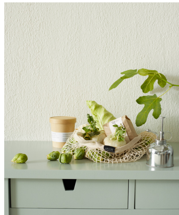
VEGG: JOTUN DRYTECH MURMALING 1024 TIDLØS MØBEL: DRYGOLIN NORDIC EXTREME VINDU OG DØR 7163 MINTY BREEZE

DRYGOLIN Nordic Extreme har en oljeglans som gir intense farger og dype kontraster. Mange har dette nymalte, glansfulle utseende som sitt ideal. Du kan se oppstrøksprøver av glansgradene hos våre forhandlere.