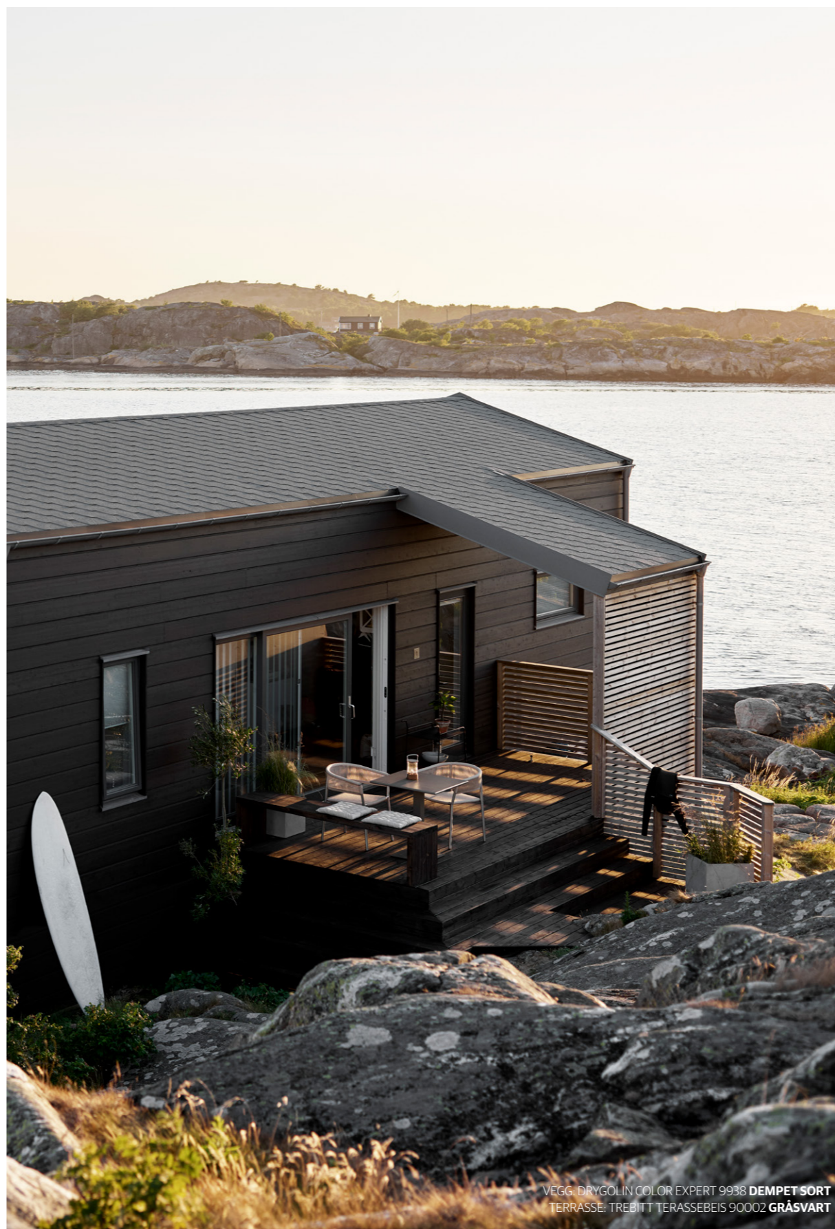
GRÅ OG SORTE NYANSER